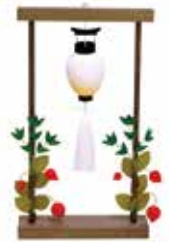
㉑ ちりめん盆飾り 笹とほおずき