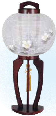
⑯ 遥(はるか) 9号 桜