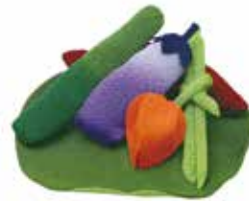
⑳ ちりめん細工お供え物(小) 野菜セットハス付 箱入