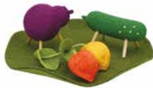
⑲ ちりめんミニ精霊馬(蓮飾り)