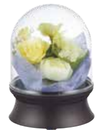
㉕ フラワードーム1号黄色