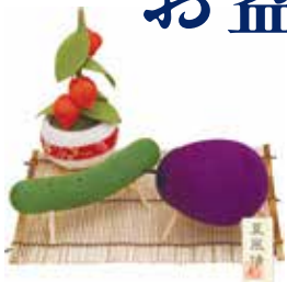
⑱ 精霊馬飾りセット 箱入