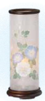
⑧ 和照灯 (霞朝顔)