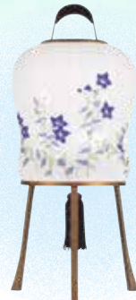
④ 華かずら 小 ききょう