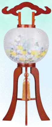
⑬ 華のケヤキ 9号