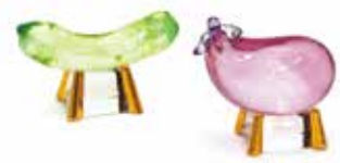
㉓ クリスタル精霊馬 箱入