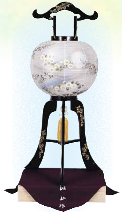
⑮ 本金萩高盛蒔絵 11号