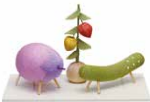
㉒ パステル精霊馬飾りセット