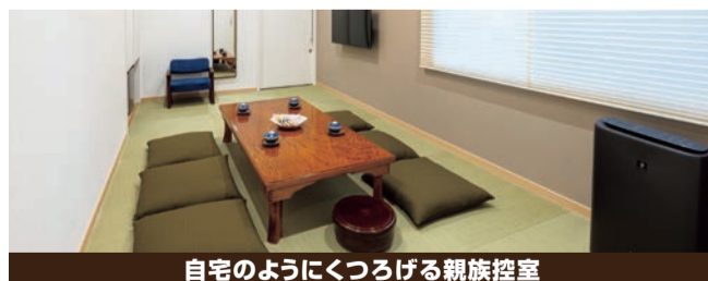
自宅のようにくつろげる親族控室