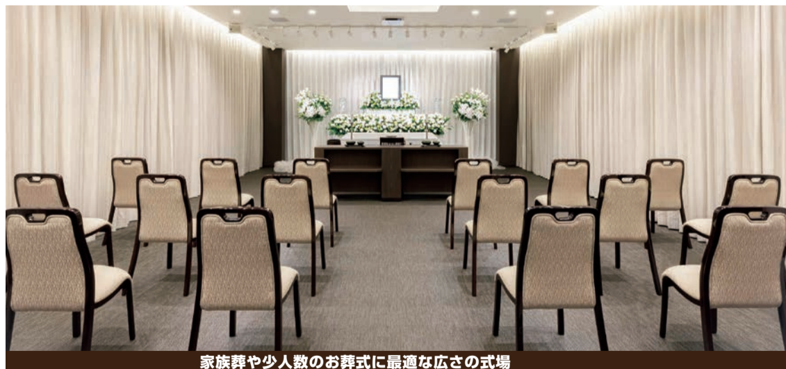
家族葬や少人数のお葬式に最適な広さの式場