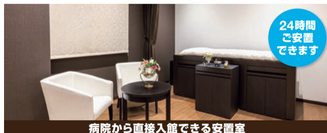
病院から直接入館できる安置室