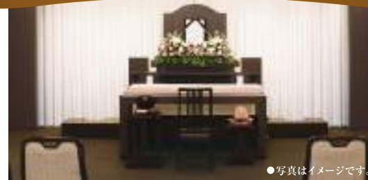
●写真はイメージです。